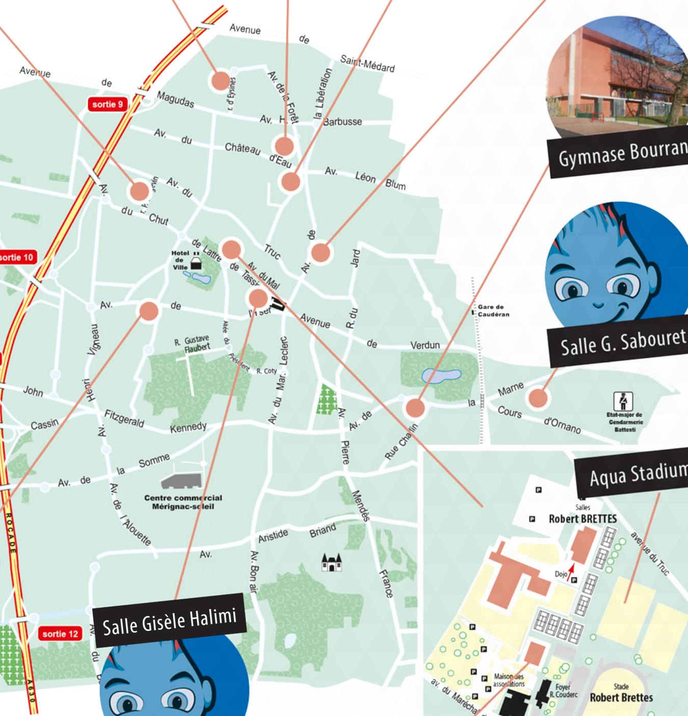
Salle Gisèle Halimi