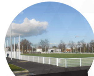
Stade du Jard