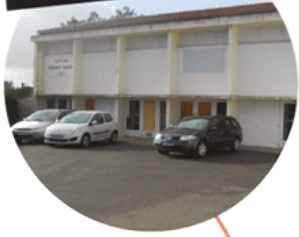
Salle E. Herriot