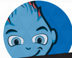
Salle G. Sabouret